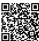
Same-Sex Marriage and Civil Unions