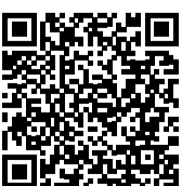
Criminalisation of consensual same-sex sexual acts

Die Karte basiert auf einer Auswertung der in der ILGA-World Datenbank verfügbaren Daten, Stand März 2026, Ergänzungen durch Hirschfeld-Eddy-Stiftung /LSVD + Map based on an elaboration of data available on the ILGA World Database, as of March 2026, with additions by the Hirschfeld-Eddy Foundation /LSVD +